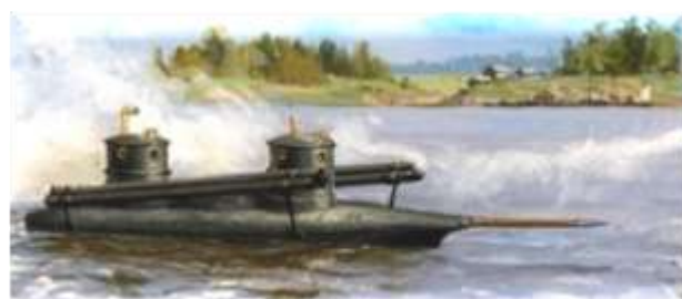
Ракетные пуски с подлодки Шильдера

В том же 1834 году подлодка была испытана экипажем из 9 человек и показала высокую точность попаданий ракет на расстоянии в 1 версту.