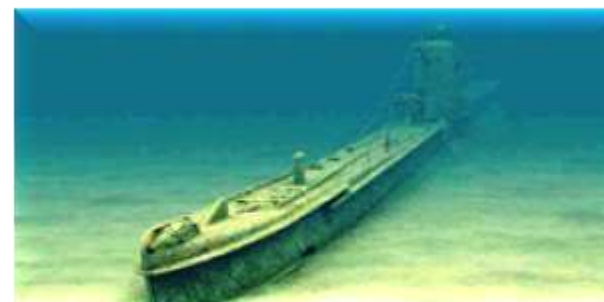
«Щ-408» на дне моря

22 мая 1943 г. ПЛ «Щ-408» была неожиданно атакована вражеским самолетом. Затем подлодку обнаружили немецкие противолодочные корабли. «Щ-408» всплыла и 3 часа вела артиллерийский бой против 5 вражеских кораблей. Расстреляв все снаряды, лодка порушилась и еще 2 суток боролась за живучесть, но была добита немцами.