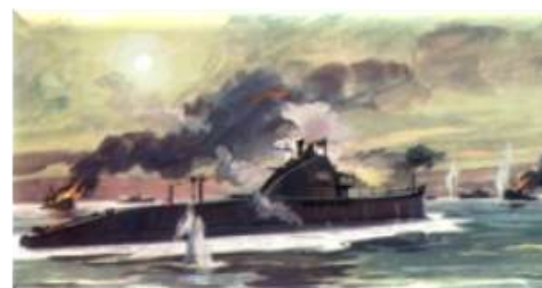
Последний бой «Щ-408» (худ. И.Родионов)

Балтийский «Варяг» – подводная лодка в первом боевом походе.