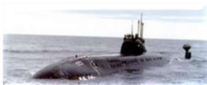
Атомная подводная лодка Б-414 «Даниил Московский»