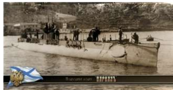
Подводная лодка «Нарвал»

Подводная лодка «Нарвал» Черноморского флота. Построена в 1915 году. В 1916 – первой половине 1917 года торпедировала вспомогательный крейсер и крупный транспорт, захватила и потопила пароход и 9 крупных парусно-моторных грузовых шхун. В 1918 году в базе захвачена интервентами и в 1919 году затоплена английскими «союзниками» на рейде Севастополя. Найдена на дне моря спасателями нашего Черноморского флота в октябре 2014 года.