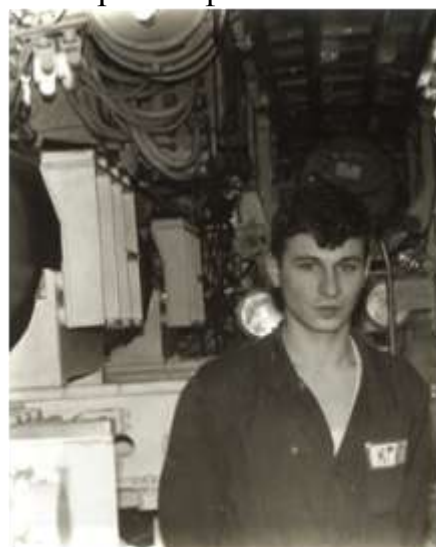
На подлодке «Даниил Московский»